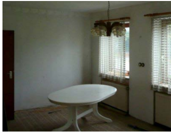
VOR HOME STAGING