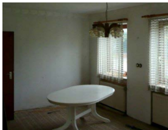
VOR HOME STAGING