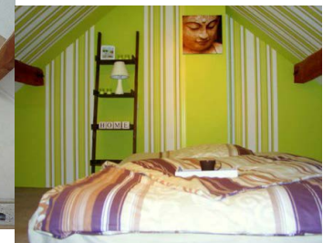
NACH HOME STAGING