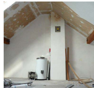
VOR HOME STAGING