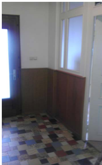
VOR HOME STAGING